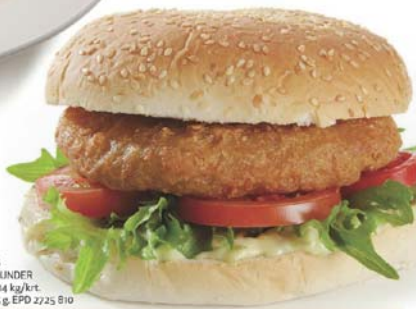
HAKE CAPENSIS 5 kg/ort. 110 /130 g. EPD 2725 828