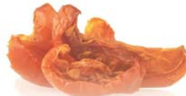
Tomatbiter, semisørket Kartong 3 kg, 6 poser à 0,5 kg EPD: 2705432