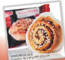
KANEL BOLLE, 35 G 2,1 kg/ort. 60 x 35 g EPD 2722 410