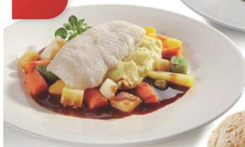
NORSKE RUSTIKKGRØNNSAKER MED GOURMETKUTT 6 kg/ort. (3x2 kg). EPD 2726 487